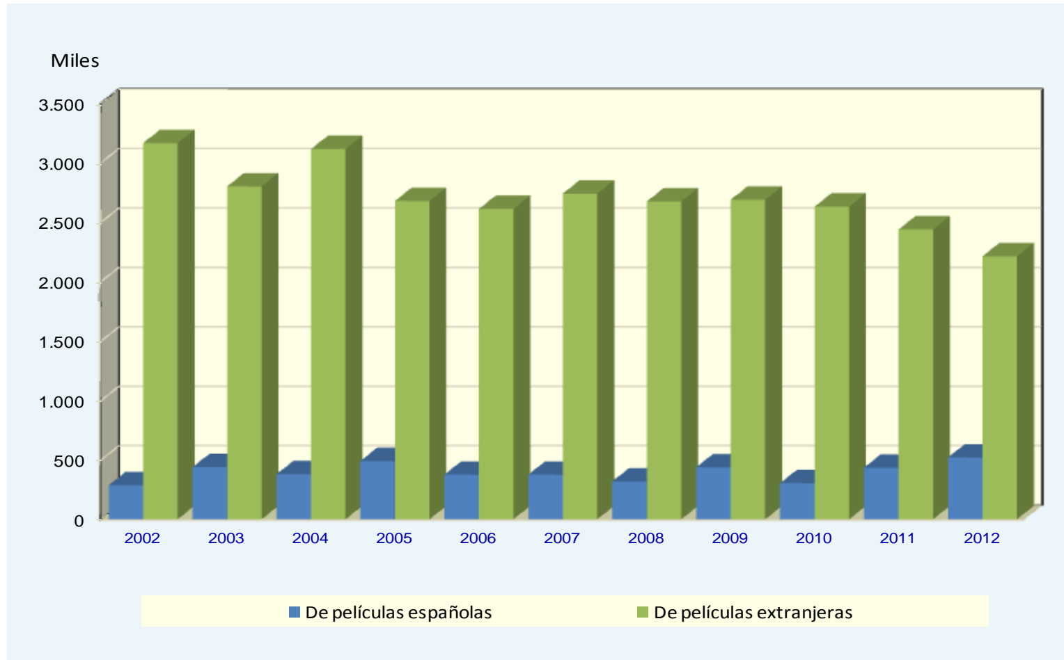
G-14.1. Gráfico de la evolución del número de espectadores de películas españolas y extranjeras.